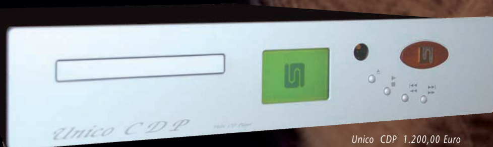
Unico CDP 1.200,00 Euro