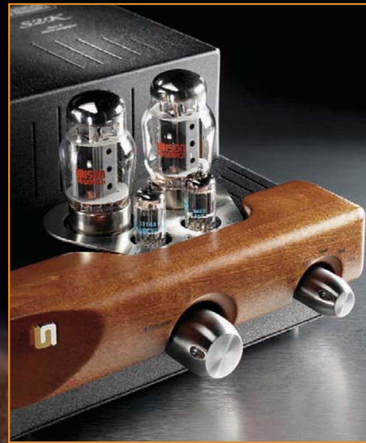
UNISON S2K 2.200,00 Euro

Wer das Hörvergnügen der Röhrentechnik kennen lernen möchte, dem bietet UNISON Einsteigermodelle an, die exklusiven Anforderungen gerecht werden: Passend zum kleinsten Röhrevollverstärker S2K gibt es den CD-Player CDP der Unico-Serie. Zunächst ist etwas Geduld gefordert, da die Komponenten etwa 100 Betriebsstunden brauchen, um ihr ganzes Potenzial zu entwickeln. Überhaupt: Musik über Röhrenverstärker zu hören ist keine Fastfood-Angelegenheit, denn sie brauchen circa 15 Minuten, bis die richtige Betriebstemperatur erreicht ist. Praxisnah ausgedrückt: Nach dem Einschalten erlebt man die Qualität eines sehr guten Transistorverstärkers, aber mit zunehmender Spieldauer gewinnt die Musik an Farbe, Weite und Intensität. Scheinbar grenzenlos erfüllt dann die Musik den Raum. Kein